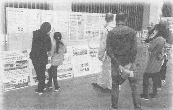
避難所生活での女性と子どもの防犯対策をチェックする親子

10月26日（土）軽井沢風越公園において令和6年度軽井沢町防災訓練が6年ぶりに開催されました。社会福祉協議会では、総合体育館メインアリーナ会場にて能登半島地震における避難所の状況や災害ボランティアの様子、女性や子ども、ペットとの避難行動に関するパネル展示を行うとともに、軽井沢町赤十字奉仕団による炊き出し訓練にも参加、とん汁とハイゼックス（炊飯袋）で炊いたご飯を訓練参加者にお配りしました。